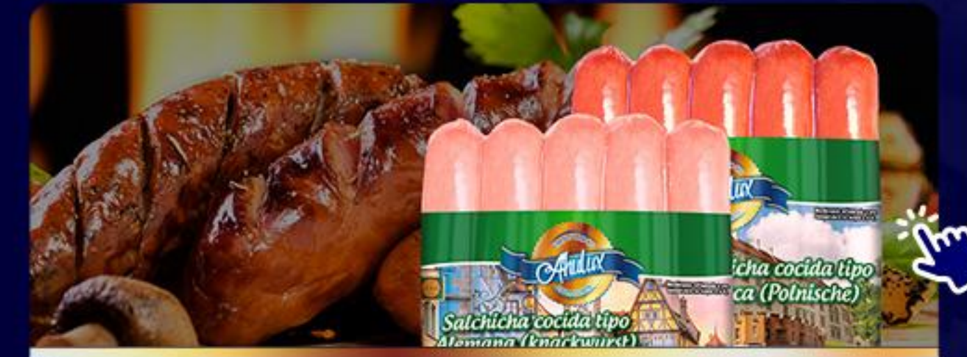
SALCHICHAS Y CHORIZOS