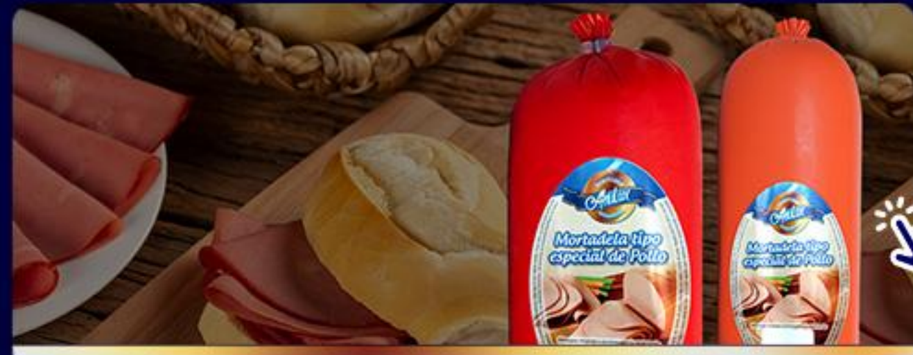
BOLOGNAS Y MORTADELAS